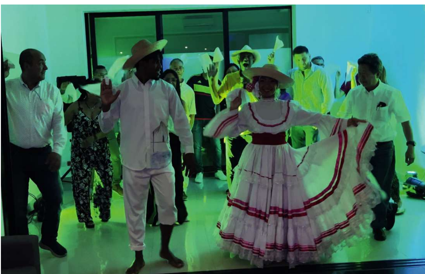
Aniversario Uniandinos Sede Uniandinos Suroccidente