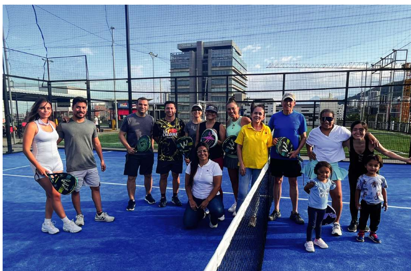
Experiencia Padel (Norte) La Cantera - 14 de la sexta