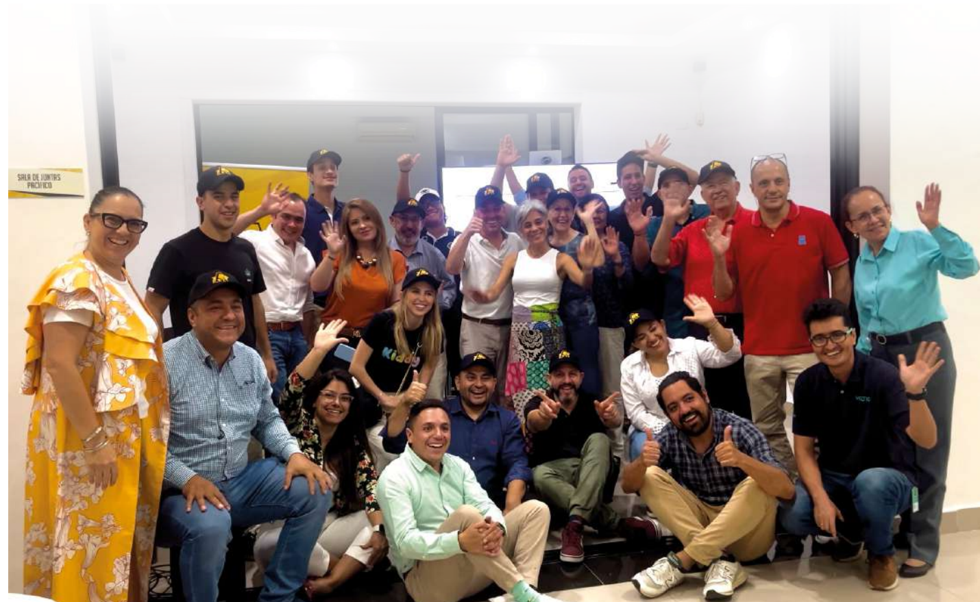
Beer & Pizza Sede Uniandinos Suroccidente