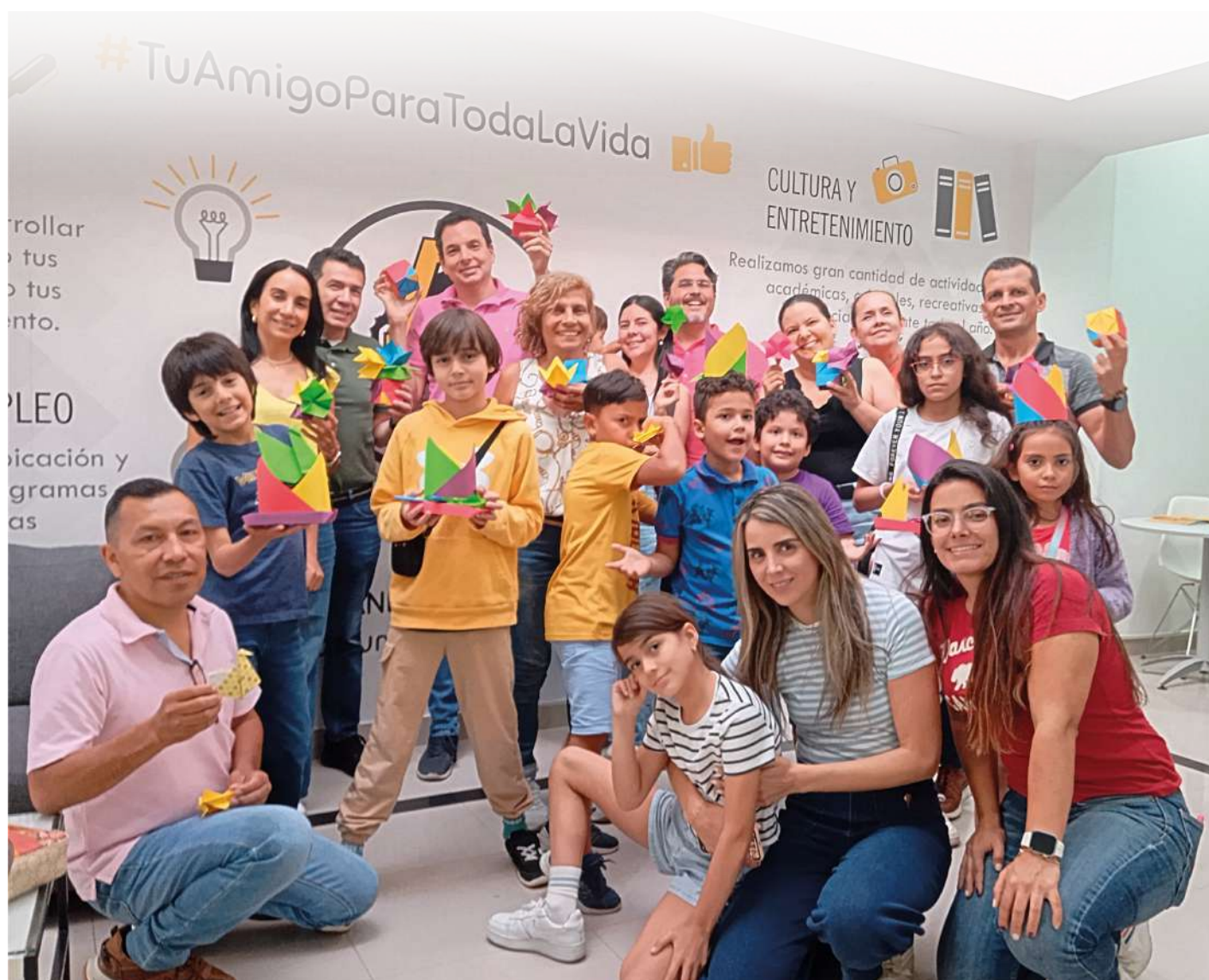
Taller Origami Sede Uniandinos Suroccidente