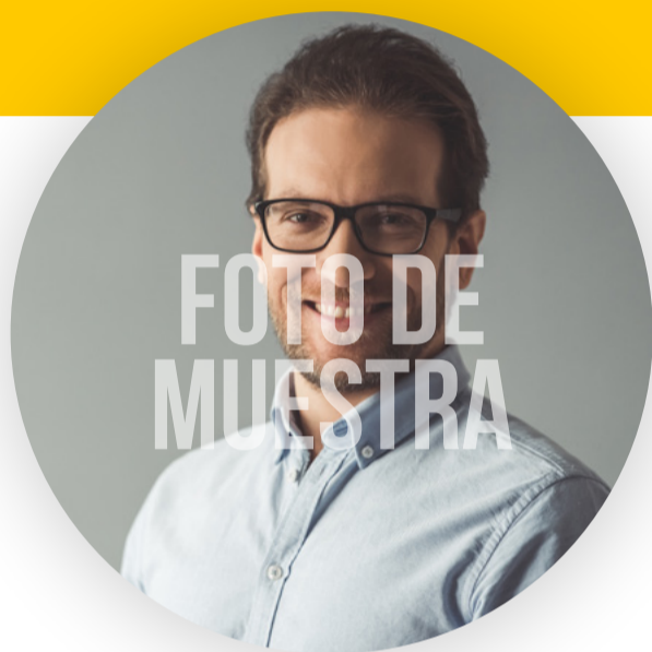
FOTO DE MUESTRA

SLOGAN AQUÍ XXXXXXXX XXXXXXXX XXXX XXXXXXXX