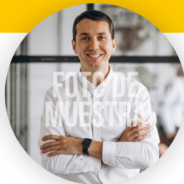
FOTO DE MUESTRA