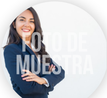
NOMBRE APELLIDO CARRERA AÑO

SLOGAN AQUÍ XXXXXXXX XXXXXXXX XXXX XXXXXXXX