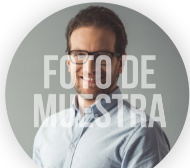
NOMBRE APELLIDO CARRERA AÑO